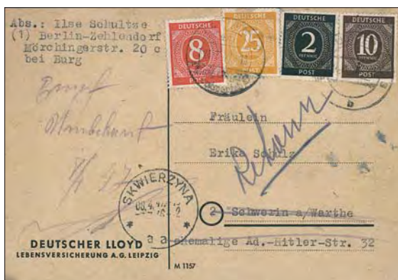
Detta brevkort som adresserats till en fröken i Schwerin, nådde aldrig adressaten. Orten hette numera Skwierzyzna och någon Ad.-Hitler-Str. 32 fanns inte längre där!

som till exempel en bit av ett radergummi eller dylikt.