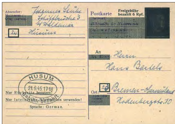
Ett trespråkigt tyskt postkort med betalt svar som efter krigsslutet övertryckts, och sedan använts inrikes i den brittiska zonen.