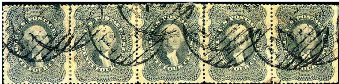
Vackert 5-strip med 24-centsmärket från 1860 som ägdes av Waterhouse och såldes 1924.

osålda objekt på Waterhouse-auktionen 1924, men förmodligen köpte Waterhouse själv tillbaka objekt som inte nådde upp till de limitpriser som hade avtalats med auktionsfirman. Vi vet dessutom att Waterhouse fortsatte att köpa bra amerikanskt material även efter auktionen 1924.