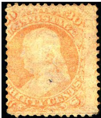
Det enda kända exemplaret av 30 cent 1861 med rättvänt tryck på båda sidor.