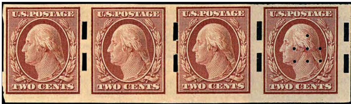
Fyrstrip som visar den privata Schermackperforeringen, typ III, samt skyddsperforering i det högra märket för tidningen Cosmopolitan .

ligen lättad när han nu kunde lämna klienterna och istället tillbringa tiden i sin kära jaktstuga nära Wild Rose i Wisconsin.