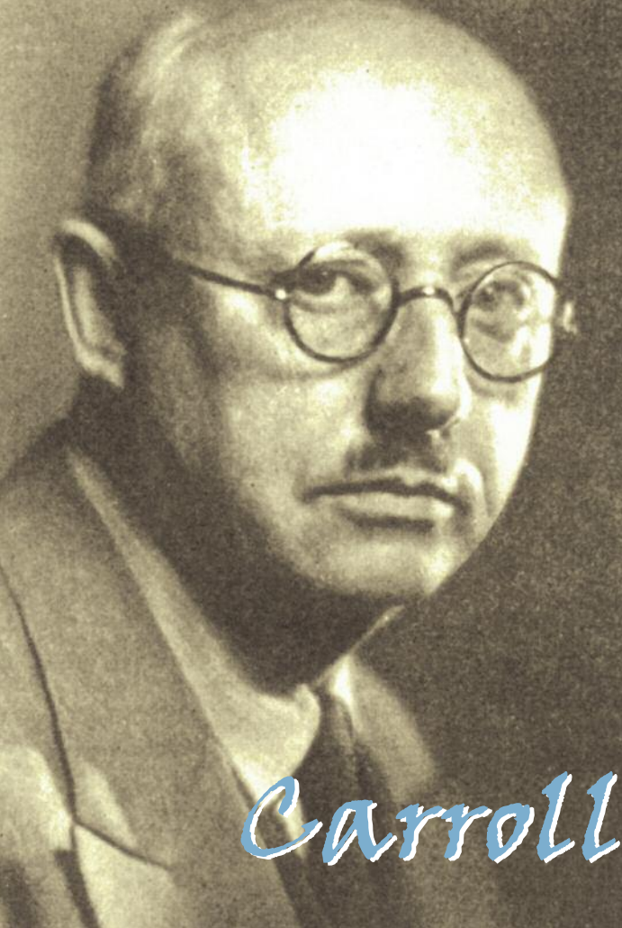
Carroll Chase (1878–1960)