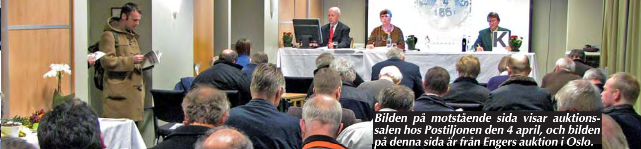
Bilden på motstående sida visar auktionssalen hos Postiljonen den 4 april, och bilden på denna sida är från Engers auktion i Oslo.