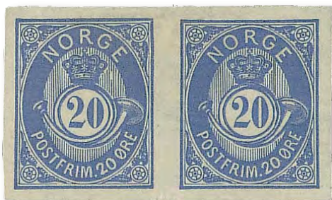
Endast 76 exemplar lär finnas. Sålt hos Engers Frimerker för motsvarande 15 860 kronor.

Ned t.h.: Tredubbelt trycksaksporto som kostade 9 820 kronor hos Engers Frimerker.