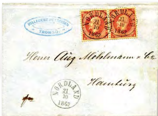
Ett brev med stämpeln "NORDLAND" typ I såldes för 21 625 kronor hos Skanfil.

skeppspostobjekt. Ett vanligt inrikes brev med ett bläckkorset 4 skilling vapen 1863 och anteckningen "D/S Olav Kyrre 10/5-69", såldes för 8.650 kronor.