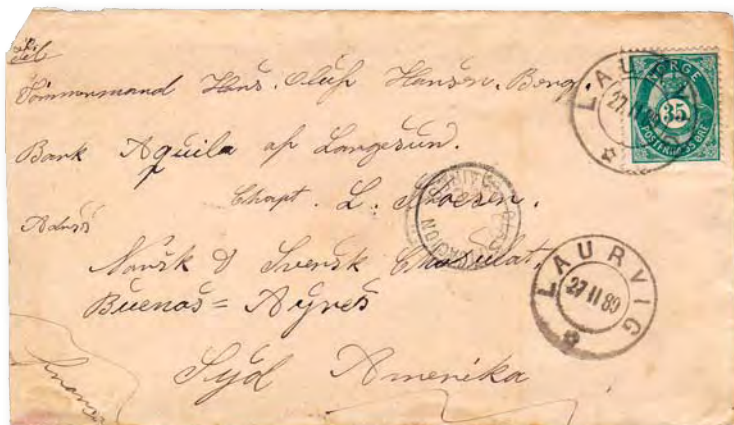
Ett sällsynt norskt brev till Argentina som kostade motsvarande 21 900 kronor hos Engers Frimerker i Oslo.

Frimärksbranschen är i dessa oroliga finanstider tydligen privilegierad jämfört med de flesta andra. Det finns uppenbarligen fortfarande massor av pengar till inköp av dyra frimärksobjekt, om man skall döma av omsättningen på auktionerna, även om en viss typ av objekt tycks ha påverkats en del prismässigt. I månadens referat kan du läsa något om hur det gick hos Engers Frimerker och Skanfil i Oslo samt hos Postiljonen.