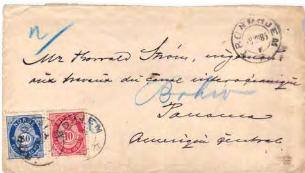
Ovan: Ett brev som skickats till Panama såldes för 16 610 kronor hos Engers Frimerker.

Ett vackert brev som skickats till Frankrike såldes hos Skanfil för motsvarande 13 125 kronor.