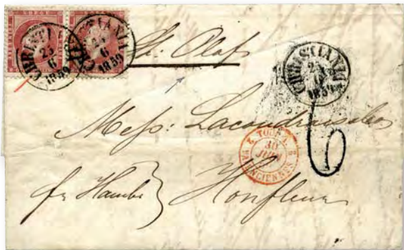
Anteckningen "St. Olaf" kostade 9 400 kronor hos Skanfil.