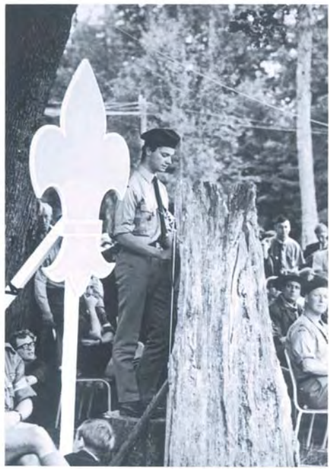
På vykortet t.v. invigningstalar dåvarande kronprins Carl Gustaf på scoutlägret vid Stegeborg, som ses på vykortet nedan. Båda korten är naturligtvis försedda med specialstämplar.