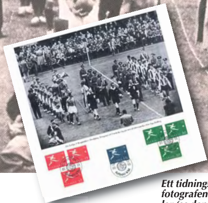
Ett tidningsfoto från invigningsmatchen den 8/6 1958 i fotbolls-VM i Norrköping. Av bl.a. detta foto gjordes souvenirer med frimärken och stämpelar (se den lilla bilden).