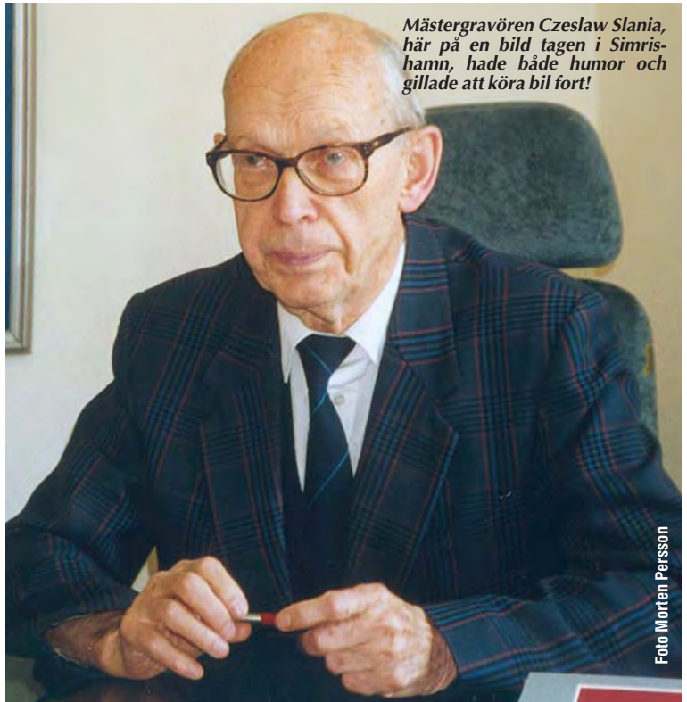
Mästergravören Czeslaw Slania, här på en bild tagen i Simrishamn, hade både humor och gillade att köra bil fort!

Under dessa år lärde han känna många intressanta människor. Ibland berättade han små episoder om sina möten med dessa människor för familjen. Jag var väl inte så värst intresserad men ibland fastnade historien, och särskilt minns jag några berättelser om vår världsberömda frimärksgravör Czeslaw Slania.